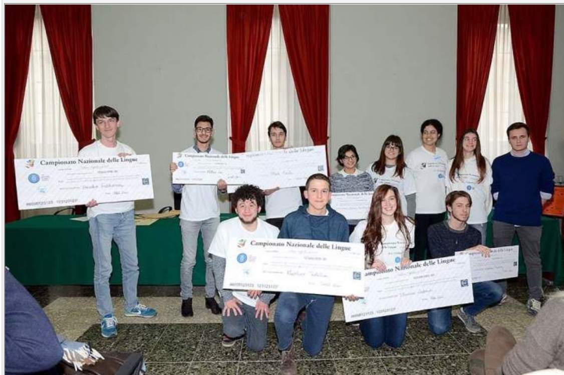
i vincitori e i piazzati del Campionato Nazionale delle Lingue 2017

Urbino - Si è concluso con un nuovo successo di partecipazione e organizzazione il Campionato Nazionale delle Lingue 2017, la manifestazione, unica nel suo genere, organizzata dal Dipartimento di Scienze della Comunicazione, Studi Umanistici e Internazionali: Storia, Culture, Lingue, Letterature, Arti, Media/Corso di Laurea in Lingue e Culture Straniere dell'Università degli Studi di Urbino Carlo Bo in collaborazione con il Centro Linguistico d'Ateneo, l'Ersu di Urbino e con il patrocinio dell'Ufficio Scolastico Regionale e del Comune di Urbino.