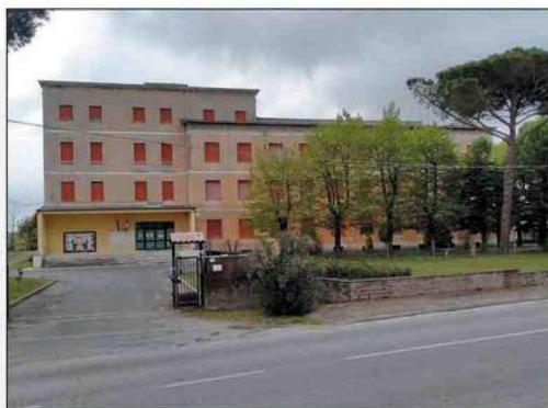
Nepi Il liceo Ulderico Midossi