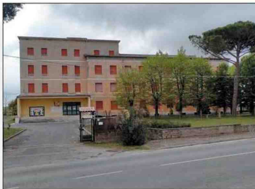
Nepi Il liceo Ulde-rico Midossi