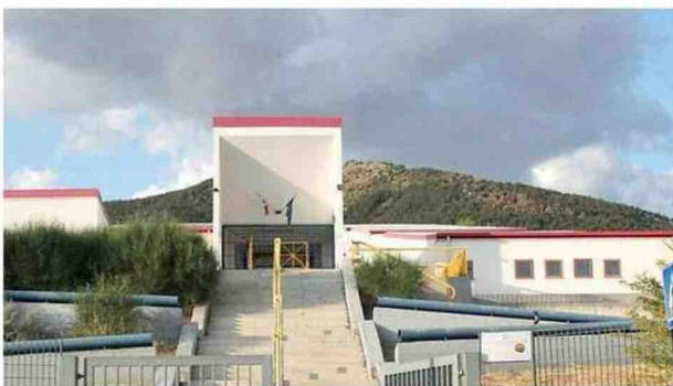
La sede di Pettino del Liceo Domenico Cotugno